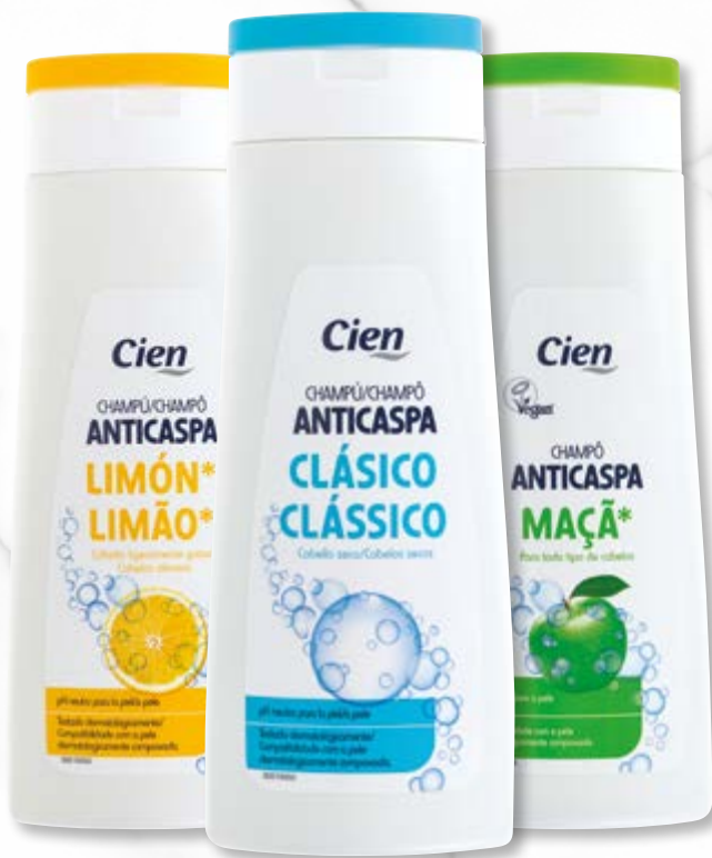
Cien® Champô Anticaspa n°88436