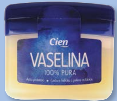
Cien® Vaselina nº5905381

A Vaselina Cien assenta em três conceitos: hidratação, cuidado e beleza . Ideal para hidratar as zonas do corpo que sofrem mais agressões climáticas, como lábios, mãos, nariz, cotovelos, pés e calcanhares, deixando-as suaves e macias.