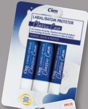
Cien® Batom Hidratante nº32440