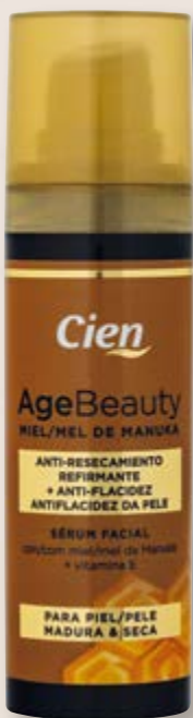
Cien® Sérum Age Beauty

Especialmente desenvolvida para peles maduras e secas, a gama Age Beauty ajuda a devolver elasticidade e suavidade à pele . A sua fórmula, com mel de Manuka e cálcio, bem como substâncias ativas, torna a pele visivelmente mais jovem. pH neutro para a pele.