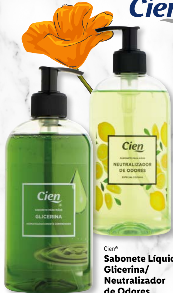
Cien® Sabonete Líquido Glicerina/ Neutralizador de Odores