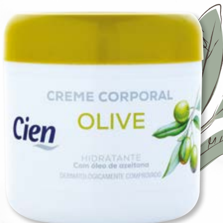
Cien® Creme Corporal Azeitona nº5712313