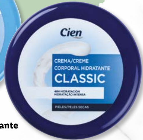
Cien® Creme Hidratante nº8048

Enriquecida com óleo de abacate e ideal para peles normais, esta loção hidrata durante 24h . De fácil aplicação e absorção, não deixa a pele oleosa, mantendo-a cuidada, suave e bonita por mais tempo .