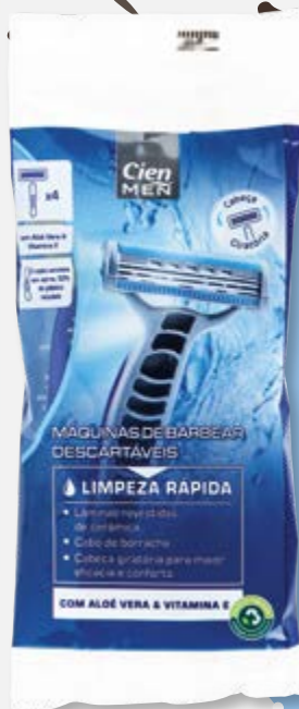
Cien® Lâminas Triplas Descartáveis n°132140

Falar de beleza inteligente é falar também, e cada vez mais, de beleza masculina. Uma beleza que se pede prática, rápida e de máxima eficiência. E como a pele do rosto do homem é mais sensível, a Cien Men garante produtos delicados , que respeitam a pele e oferecem cuidados profundos .