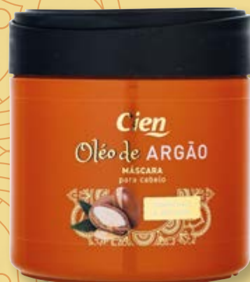
Cien® Máscara de Cabelo Argão nº5712495

Este óleo fortalecedor, de textura leve e de rápida absorção, facilita o pentear e deixa o cabelo cuidado, macio, nutrido e muito brilhante .