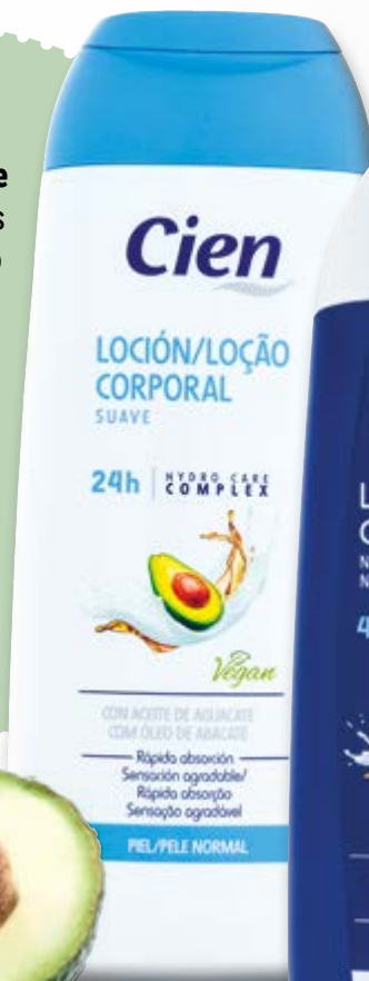
Cien® Leite/ Loção Corporal nº8058