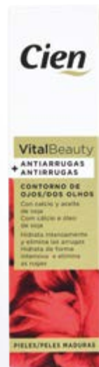
Cien® Vital Beauty Contorno de Olhos nº40003