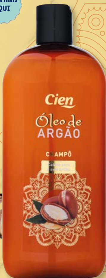
Cien® Champô de Argão nº5712496

As suas propriedades reparadoras e hidratantes , ideais para cabelos secos e indisciplinados, deixam o cabelo mais liso e sedoso .