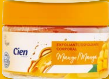
Cien® Esfoliante Corporal Coco/ Manga nº176562