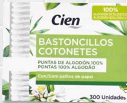
Cien® Cotonetes de Algodão n°182706