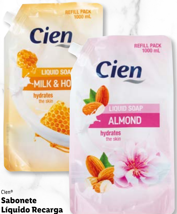
Cien® Sabonete Líquido Recarga