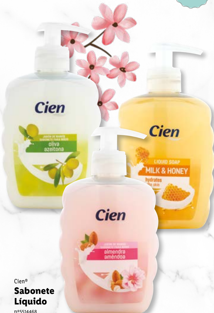
Cien® Sabonete Líquido