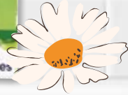
Cien® Cotonetes de Algodão n°182706