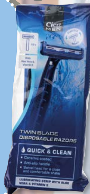
Cien® Lâminas Descartáveis n°163333