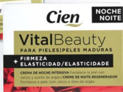
Cien® Vital Beauty Creme de Rosto Dia/ Noite nº98905