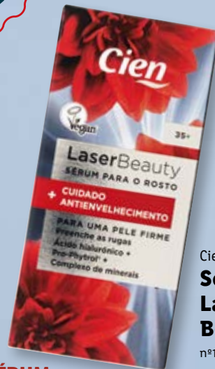
Cien® Sérum Laser Beauty n°169206

A fórmula POWER-LIFT com ácido hialurónico e Pro-Phytrol atua nos sinais de envelhecimento da pele nutrindo-a com minerais ricos. O Pro-Phytrol reduz visivelmente a profundidade das rugas e favorece a matriz da pele , deixando o contorno do rosto mais firme em 28 dias. Fórmula rapidamente absorvida.