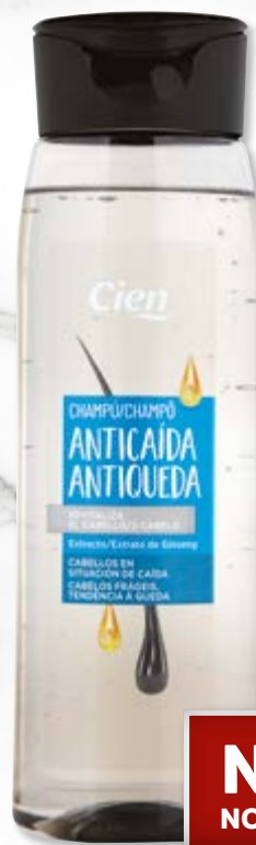
Cien® Champô Antiqueda n°5718314