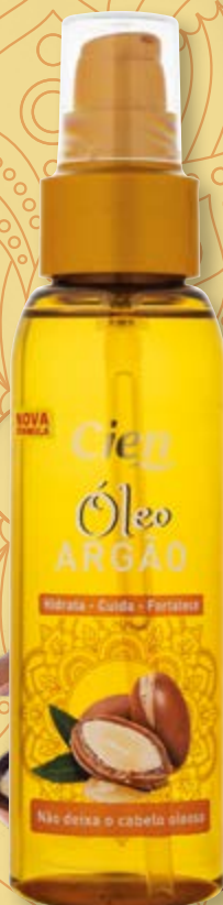
Cien® Óleo de Argão nº5702733

As suas propriedades reparadoras e hidratantes , ideais para cabelos secos e indisciplinados, deixam o cabelo mais liso e sedoso .