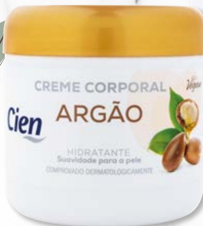
Cien® Creme Corporal Argão/ Coco nº5715607