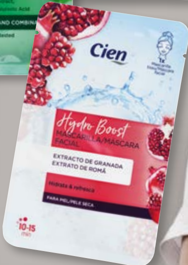
Cien® Máscara Facial de Tecido nº141870