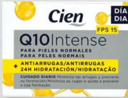
Cien® Q10 Creme Anti-Rugas Dia n°8092

CREME DE DIA Com FPS 15 , graças à sua ação hidratante e protetora, minimiza as rugas e ajuda a prevenir a sua formação.